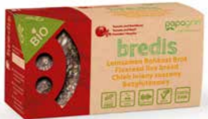
PL Pomidor i Bazylia ENG Tomato and Basil