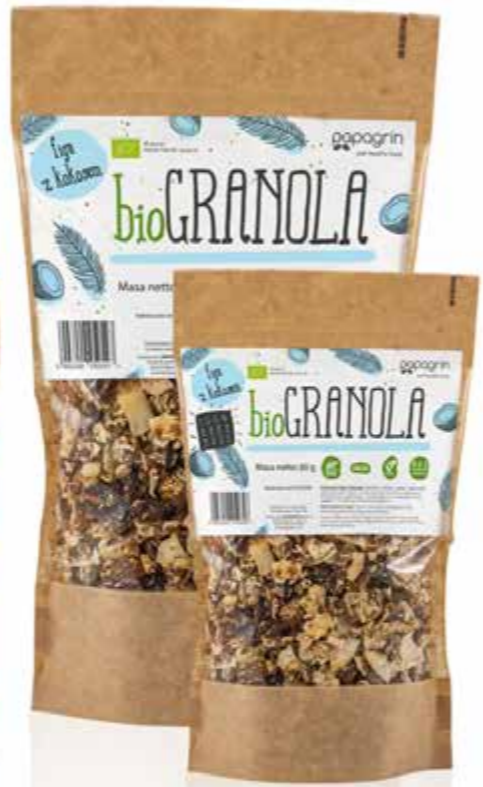
PL Figa z Kokosem ENG Figs with Coconut