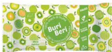
PL Jabłko ENG Apple