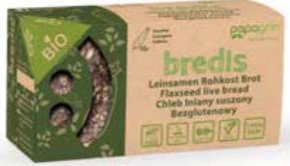
PL Cukinia ENG Courgette