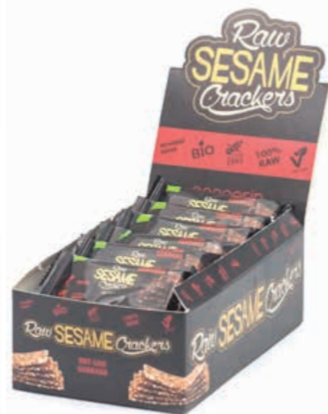
PL Buraczki i Imbir ENG Beetroot and Ginger