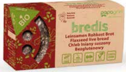
PL Buraczek ENG Beetroot