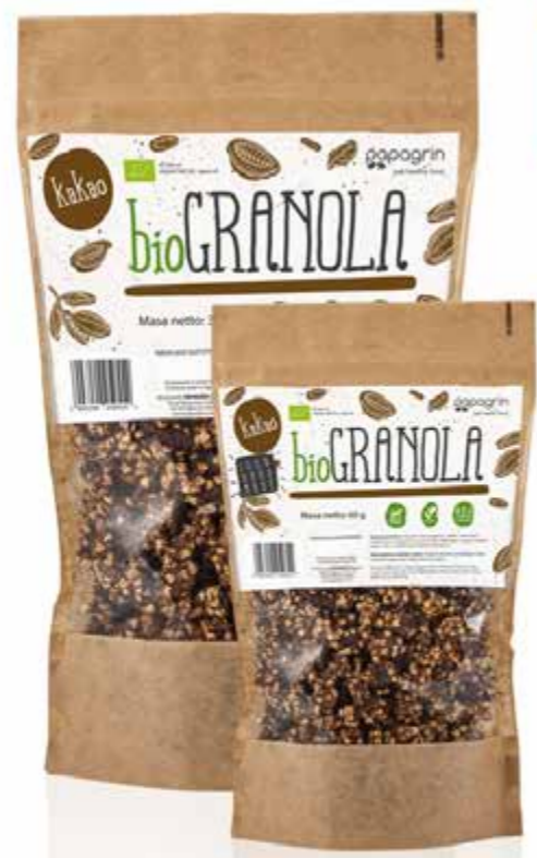
PL Kakao ENG Cocoa