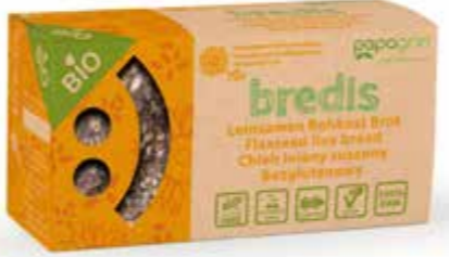
PL Słonecznik ENG Sunflower and Flaxseeds