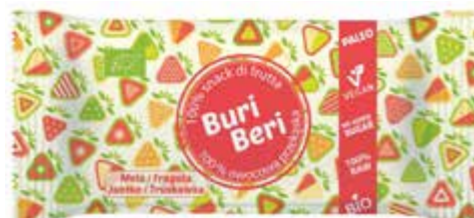
PL Jabłko i Truskawka ENG Apple and Strawberry