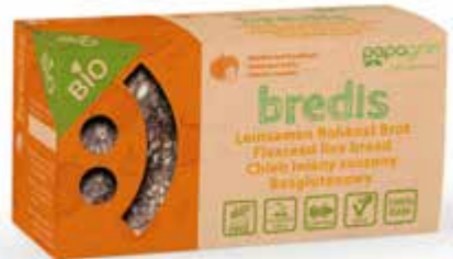
PL Cebula i Czosnek ENG Onion and Garlic