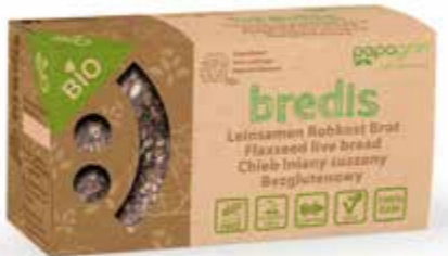
PL Kapusta kiszona ENG Sour Cabbage