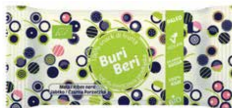
PL Jabłko i Czarna Porzeczka ENG Apple and Blackcurrant