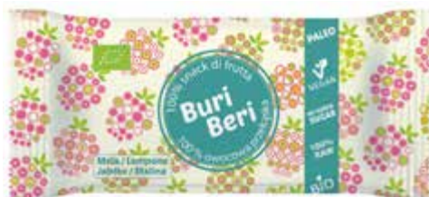
PL Jabłko i Malina ENG Apple and Raspberry