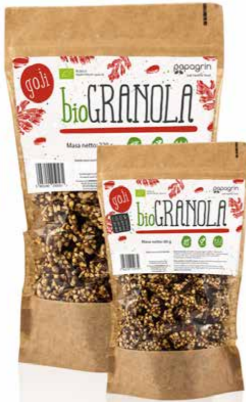
PL Goji ENG Goji